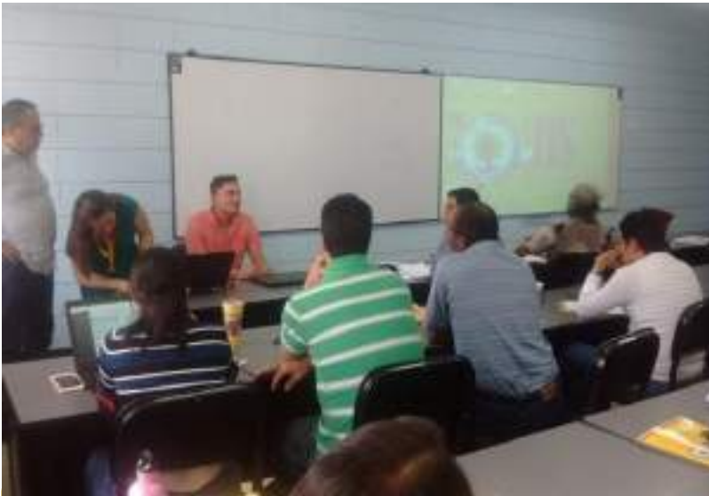
Los asistentes fueron docentes y alumnos que realizan investigaciones