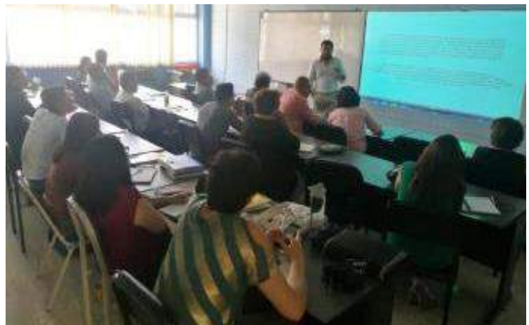
El curso se desarrolló en la sala de Coordinación General de Posgrados de la FCCSS