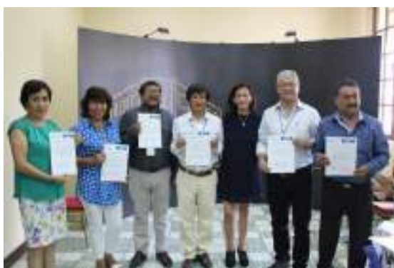
Entrega de certificados a los participantes

El Instituto de Investigaciones Sociales de la UNAH en alianza con la Universidad de Alicante, organizó el VII Seminario Internacional Honduras 2019: Red de impulso a la redistribución de género en carreras masculinizadas.