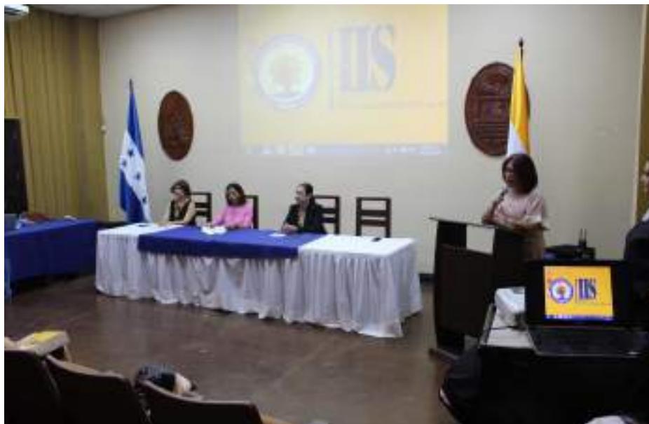
Mesa principal del VII Seminario de red de género.