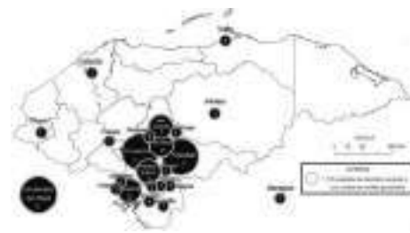
Mapa1. Distribución geográfica de los lugares de origen de las prostitutas que servían en Tegucigalpa y Comayagüela 1935-1936

Fuente: elaboración propia con datos de la Revista de Policía 1935-1937, en los números 28, 29, 30, 32, 37, 43, 50 y 52