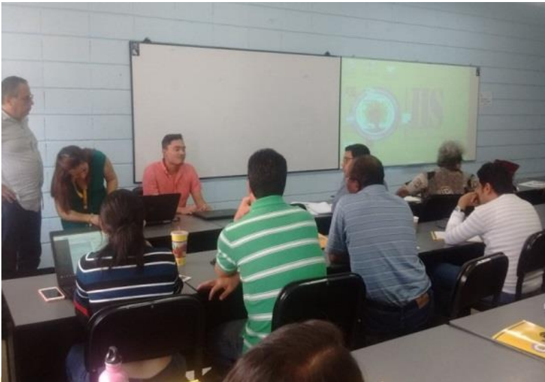
Los asistentes fueron docentes y alumnos que realizan investigaciones