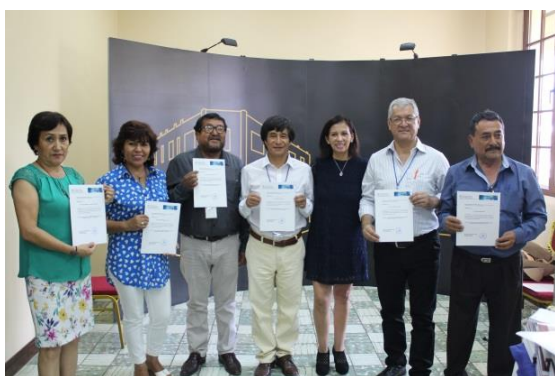
Entrega de certificados a los participantes

El Instituto de Investigaciones Sociales de la UNAH en alianza con la Universidad de Alicante, organizó el VII Seminario Internacional Honduras 2019: Red de impulso a la redistribución de género en carreras masculinizadas.