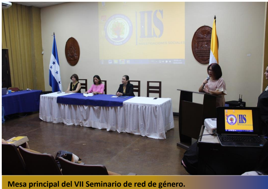
Mesa principal del VII Seminario de red de género.