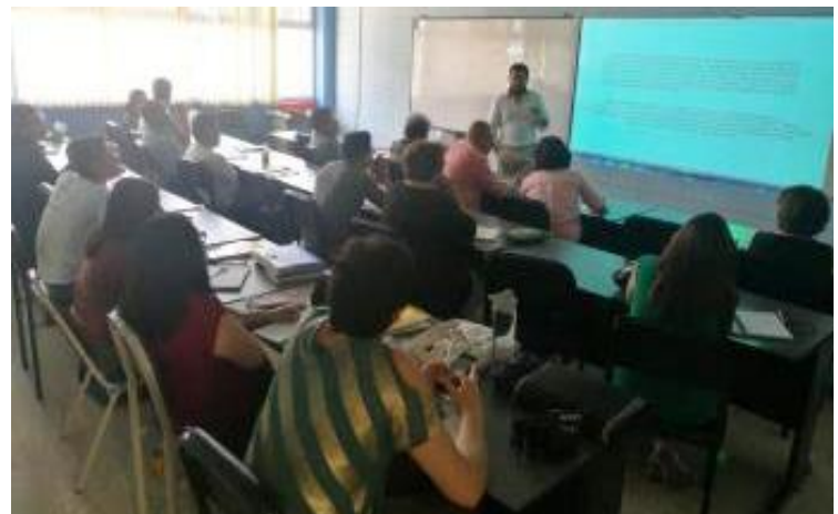
El curso se desarrolló en la sala de Coordinación General de Posgrados de la FCCSS